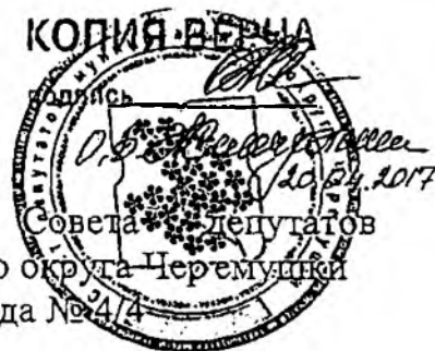
Схема многомандатных избирательных округов по выборам депутатов Совета депутатов муниципального округа Черемушки в городе Москве

Приложение к решению муниципального округа Черемушки от 30.03.2017 года № 4/4